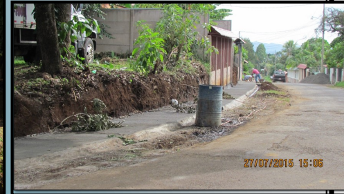
Recuperación Camino viejo al Volcán C. La Legua-Cabuyal